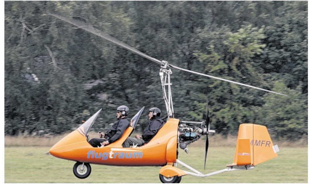
Sie flogen auch bei schlechtem Wetter: Pilot Dirk Müller hob immer wieder mit seinem Gyrocopter ab, in dem die Fluggäste im Freien saßen.