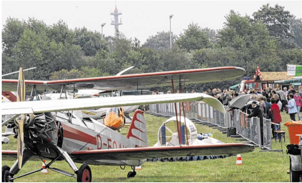
Der rot-weiße Doppeldecker Focke-Wulf FW 44 Stieglitz (vorne) war einer der Hingucker auf dem Flugplatzfest. Bekannt ist die Maschine durch den Film „Quax, der Bruchpilot“ mit Heinz Rühmann.

„Doktorspiele“ (15.30 Uhr, 17.45 Uhr und 20.45 Uhr); „Can a Song save your're Life?“ (15.45, 18, 20.15 Uhr); 3D „Guardians of the Galaxy“ (14.45, 17.30, 20.15 Uhr); „Lucy“ (16, 18.15, 20.45 Uhr); „The Expendables 3“ (20.15 Uhr); 3D „Planet der Affen – Revolution“ (18, 20 Uhr); „22 Jump Street“ (18.15 Uhr); „Monsieur Claude und seine Töchter“ (16.45 Uhr); 3D „Transformers 4: Ära des Untergangs“ (20.30 Uhr); 3D „Planes 2 – Immer im Einsatz“ (14.45 Uhr); „Saphirblau“ (15.45 Uhr); „Storm Hunters“ (16 Uhr).